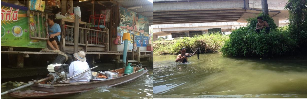
ภาพที่ 1 วิธีชีวิตริมน้ำภายในตลาดน้ำคลองลัดมะยม

การอนุรักษ์สิ่งแวดล้อม ประชาชนในชุมชนตลาดน้ำคลองลัดมะยมนั้นยังมีความพึงพอใจในการได้รับการบริการต่าง ๆ อย่างดี เช่น การบริการการบริการน้ำประปา การบริการไฟฟ้า การบริการโทรศัพท์ การบริการด้านสุขภาพสุขอนามัย และพื้นที่ชุมชนมีความเหมาะสมเพียงพอต่อประชาชนที่อยู่อาศัย