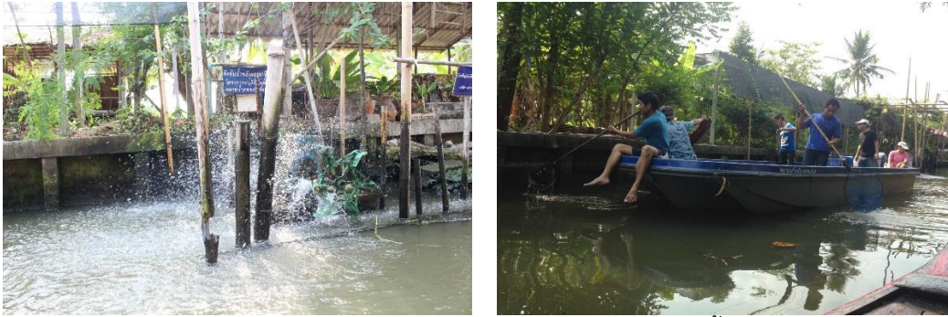
ภาพที่ 3 ภาพการร่วมมือกันเพื่ออนุรักษ์น้ำ

คณะมนุษยศาสตร์และสังคมศาสตร์ มหาวิทยาลัยราชภัฏสวนสุนันทา