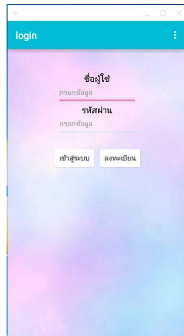
ภาพที่ 1.2 หน้าเข้าสู่ระบบ(Login)