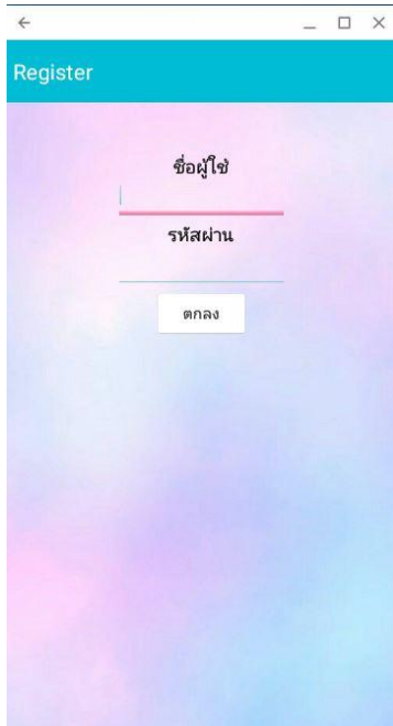
ภาพที่ 1.3 หน้าสมัครสมาชิก

ณ คณะมนุษยศาสตร์และสังคมศาสตร์ มหาวิทยาลัยราชภัฏสวนสุนันทา