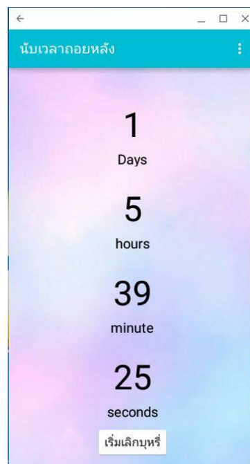
ภาพที่ 1.6 หน้านับเวลาถอยหลังถึงวันที่เลิกบุหรี่