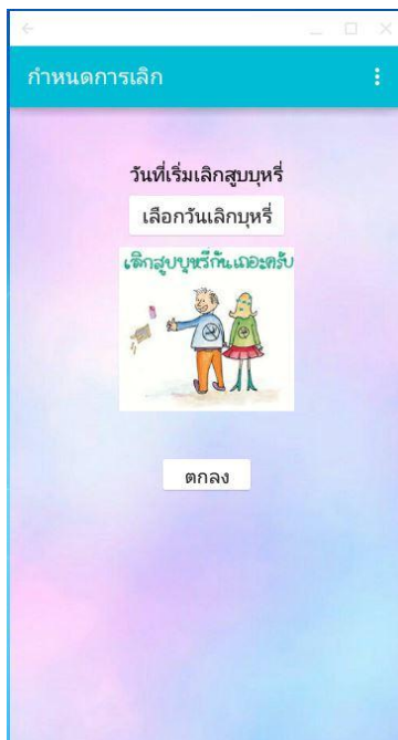
ภาพที่ 1.5 หน้ากำหนดวันเลิกบุหรี่