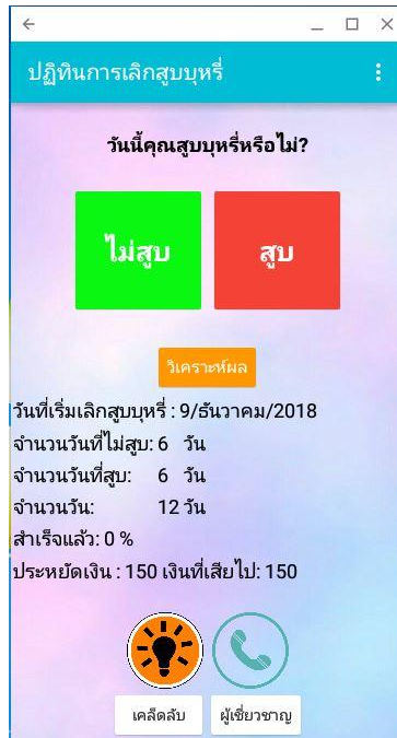
ภาพที่ 1.5 หน้าหลักของแอปพลิเคชัน ให้ผู้ใช้รายงานการสูบบุหรี่ต่อวัน

การประชุมวิชาการนำเสนอผลงานวิจัยระดับชาติของนักศึกษาด้านมนุษยศาสตร์และสังคมศาสตร์ ครั้งที่ 2 วันที่ 19 มกราคม 2562 ณ คณะมนุษยศาสตร์และสังคมศาสตร์ มหาวิทยาลัยราชภัฏสวนสุนันทา