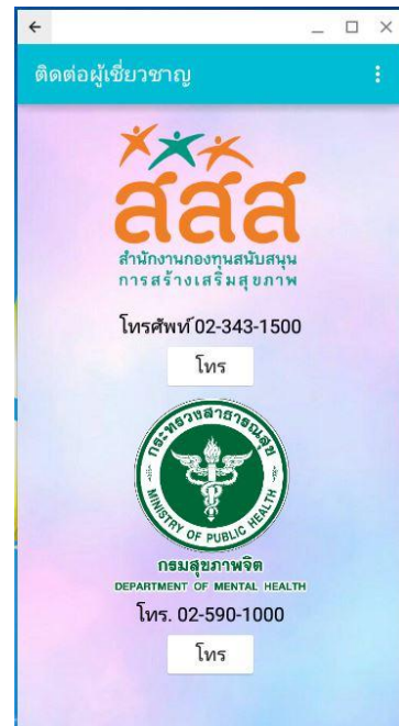
ภาพที่ 1.7 หน้าแสดงหน่วยงานที่เกี่ยวข้อง