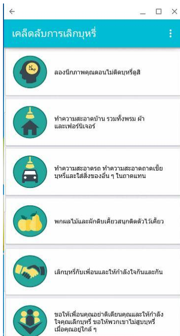
ภาพที่ 1.6 หน้าแสดงวิธีการเลิกบุหรี่