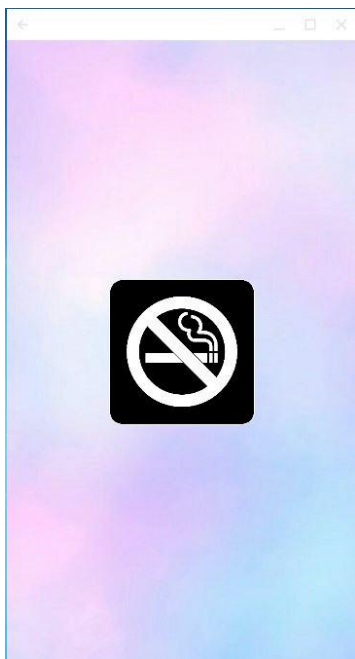
ภาพที่ 1.1 หน้าแรกเมื่อเข้าแอปพลิเคชัน