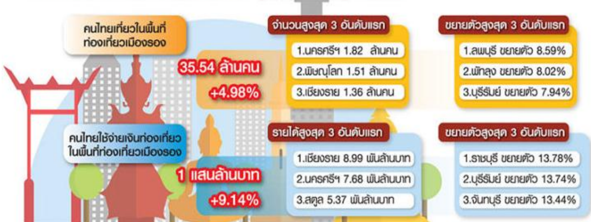
ภาพที่ 3 แสดงสถานการณ์ท่องเที่ยวชาวไทยในพื้นที่ท่องเที่ยวเมืองรอง ปี 2561 พบว่าจำนวนคนไทยมีอัตราเพิ่มขึ้น 4.98% และรายได้จากการท่องเที่ยวมีอัตราเพิ่มขึ้น 9.14%