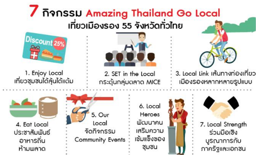
ภาพที่ 1 แสดงแผนส่งเสริมการท่องเที่ยว Amazing Thailand Go Local : เที่ยวท้องถิ่นไทย ชุมชนเติบโต เมืองไทยเติบโต แบ่งออกเป็น 7 กิจกรรม

รวบรวมเอกสารและงานวิจัยที่เกี่ยวข้องกับข้อมูลสถานที่ท่องเที่ยวเชิงวัฒนธรรมจากเอกสารที่ได้มาจากแหล่งต่างๆ รวมถึงการค้นคว้าข้อมูลเกี่ยวกับการท่องเที่ยวเมืองรอง 55 จังหวัดด้วยการติดตามข่าวสารจากการท่องเที่ยวแห่งประเทศไทยที่เป็นผู้จัดแคมเปญ Amazing Thailand Go Local และศึกษาขบวนการท่องเที่ยว ปี 2561 โดยจะมุ่งเน้นในเรื่องของกิจกรรมที่มีความเกี่ยวข้องกับนโยบาย