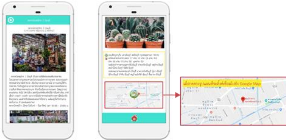
ภาพที่ 2 แอปพลิเคชันแนะนำสถานที่ท่องเที่ยวเขตมีนบุรี กรุงเทพมหานคร

ณ คณะมนุษยศาสตร์และสังคมศาสตร์ มหาวิทยาลัยราชภัฏสวนสุนันทา