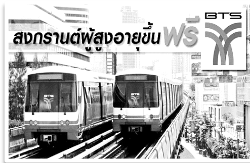
รถไฟฟ้าบีทีเอส ให้ผู้สูงอายุใช้บริการฟรี ในช่วงเทศกาลสงกรานต์

สิทธิและสวัสดิการผู้สูงอายุ ด้านการลดหย่อนค่าโดยสารสาธารณะ ในการเดินระบบรางทางการรถไฟ แห่งประเทศไทย อำนวยความสะดวกให้ผู้สูงอายุได้รับการลดค่าโดยสารครึ่งราคาทุกชั้นตลอดทาง ทุกสาย (ไม่ รวมค่าธรรมเนียม) ระหว่างเดือนมิถุนายน – กันยายน โดยผู้สูงอายุไม่ต้องเข้าแถวรอซื้อตั๋ว มีที่นั่งรองรับตัว พนักงันช่วยยกสัมภาระ ในส่วนของการเดินทางโดย แอร์พอร์ต เรล ลิงค์ ผู้สูงอายุได้รับการลดค่าโดยสารให้ ผู้สูงอายุครึ่งราคา โดยใช้บัตรผู้สูงอายุ (senior card) และรถไฟฟ้าใต้ดิน (MRT) ผู้สูงอายุได้รับการลดค่า โดยสารครึ่งราคาเป็นไปตามข้อบังคับที่กำหนด รวมถึงผู้สูงอายุได้รับสิทธิ์บริการรถไฟฟ้า BTS ที่สถานี หมอ ชิต สยาม อโศก อ่อนนุช และช่องนนทรี