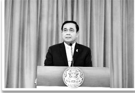
พลเอกประยุทธ์ จันทร์โอชา นายกรัฐมนตรีและหัวหน้าคณะรักษาความสงบแห่งชาติ

ณ คณะมนุษยศาสตร์และสังคมศาสตร์ มหาวิทยาลัยราชภัฏสวนสุนันทา