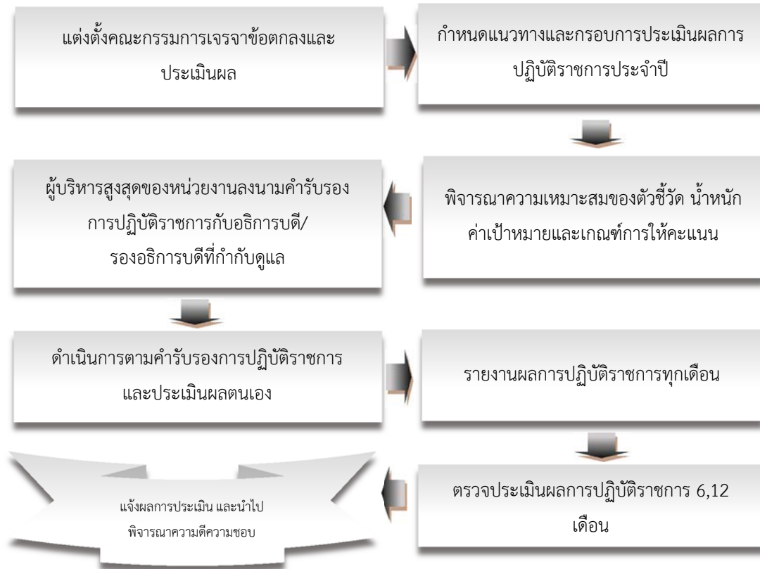
ภาพ 1.1 ขั้นตอนการจัดทำคำรับรองการปฏิบัติราชการ