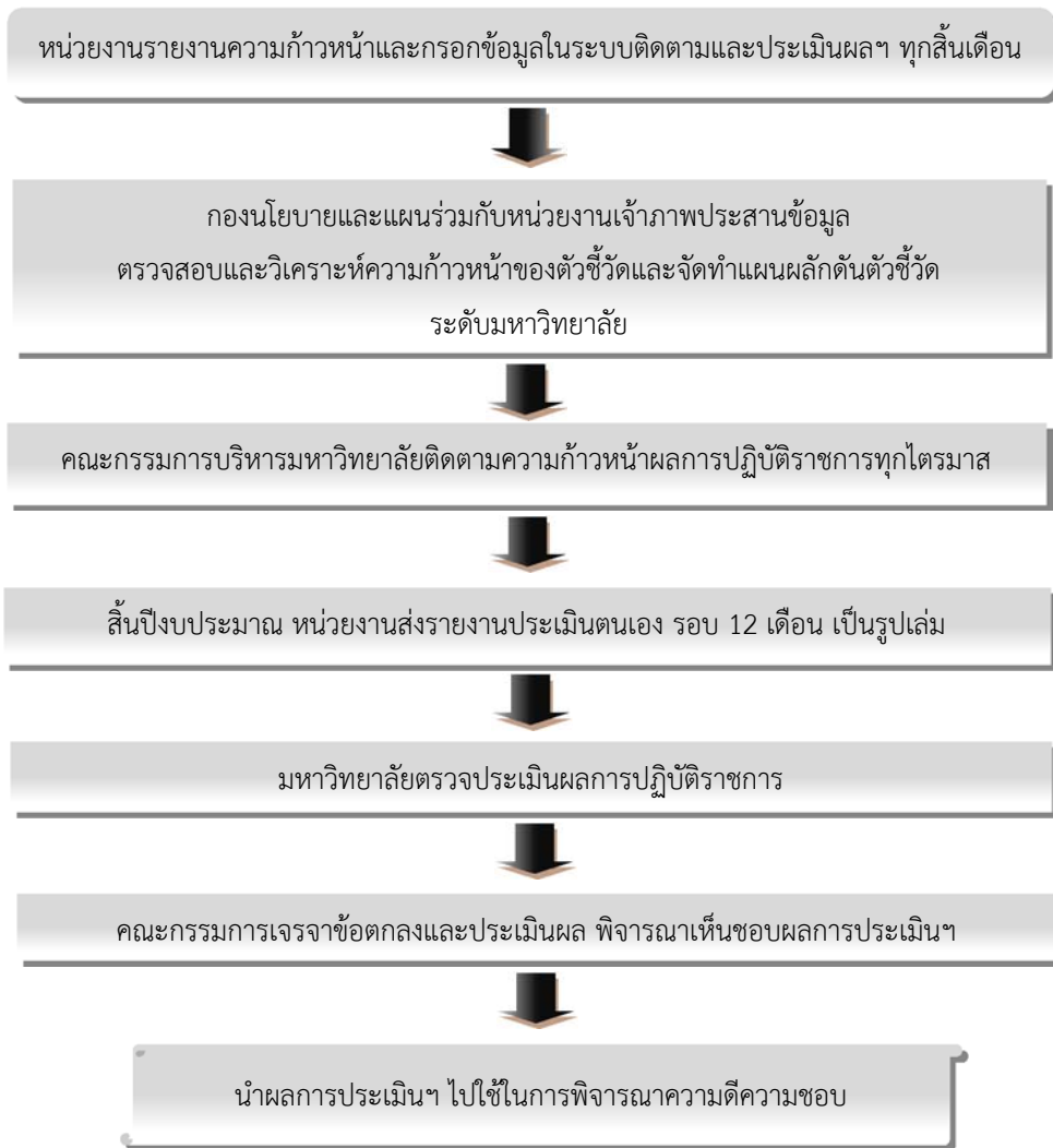
ภาพ 1.2 ขั้นตอนการติดตามและประเมินผลการปฏิบัติราชการ