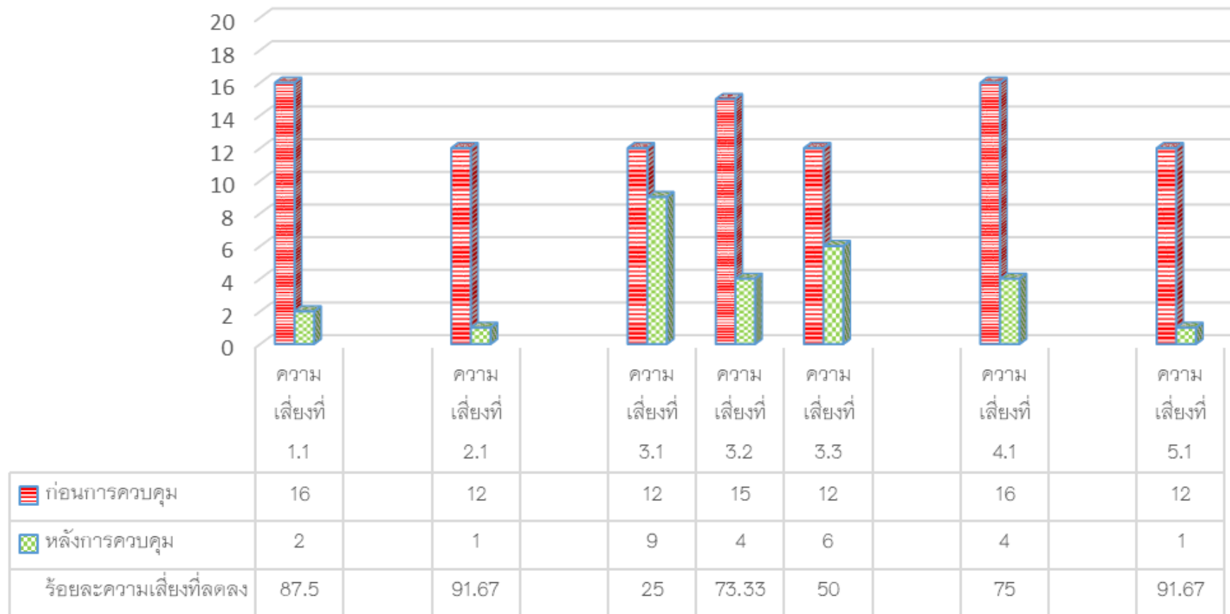
ภาพที่ 1 แสดงผลการบริหารจัดการความเสี่ยง ประจำปีงบประมาณ พ.ศ. 2564 ระดับมหาวิทยาลัย