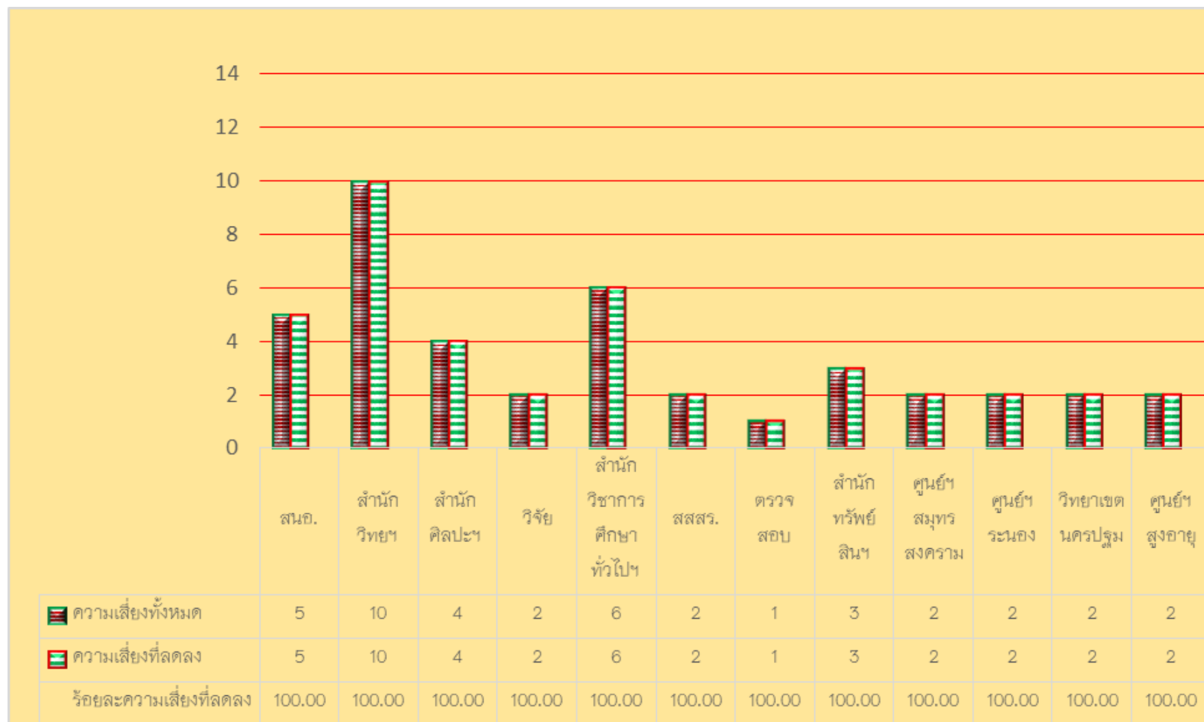
ภาพที่ 3 แสดงผลการบริหารจัดการความเสี่ยง ประจำปีงบประมาณ พ.ศ. 2564 หน่วยงานสนับสนุนการจัดการศึกษา