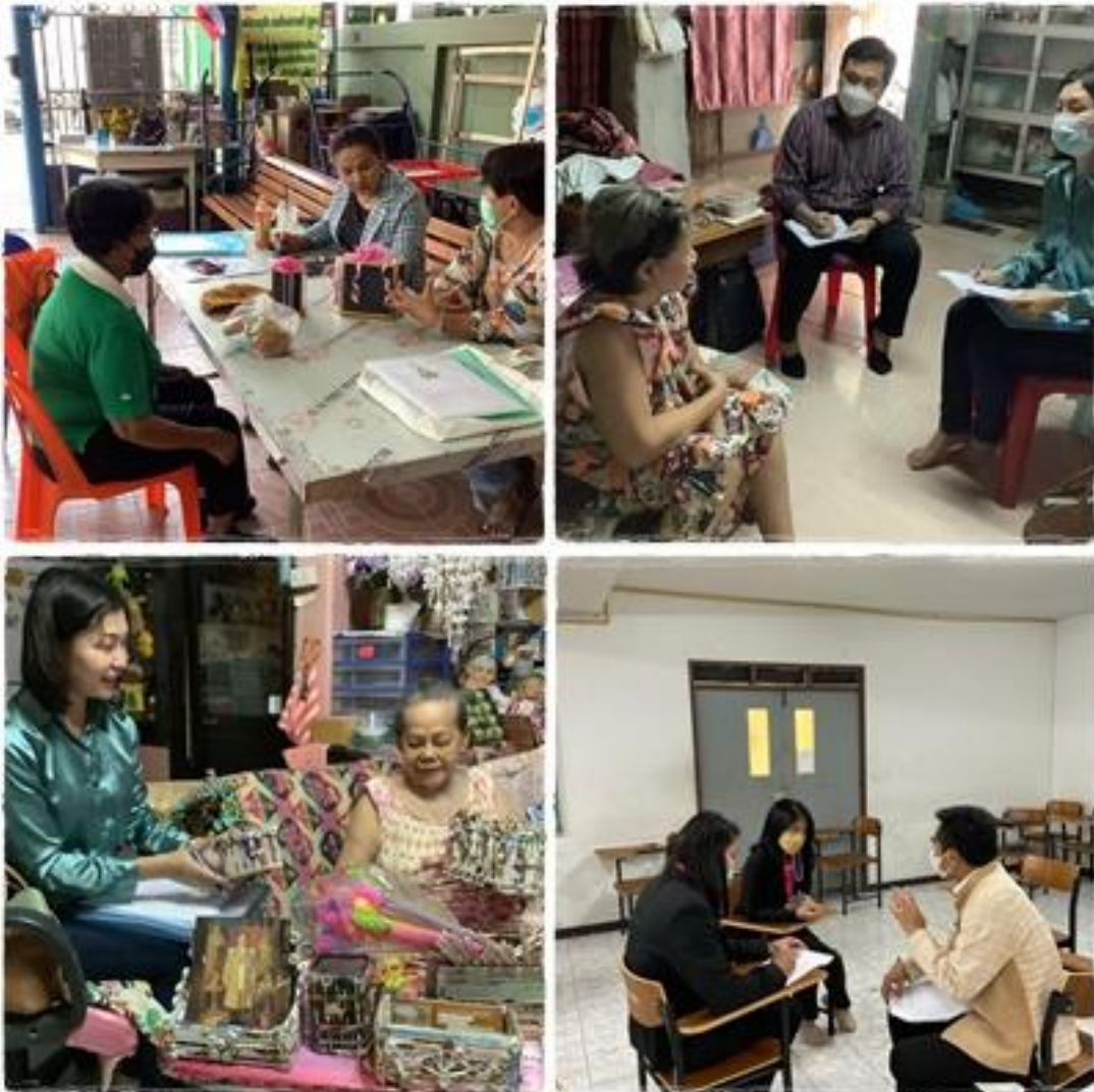
ภาพที่ 1-4 บรรยากาศการลงพื้นที่สำรวจความต้องการของครัวเรือนที่ตกเกณฑ์เส้นความยากจน และการหารือเกี่ยวกับการทำความร่วมมือกับภาคีเครือข่าย