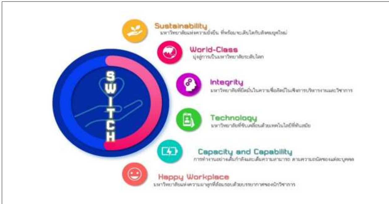
ภาพที่ 2 SSRU “SWITCH”

ทั้งนี้ สามารถแสดงเป้าหมายการพัฒนามหาวิทยาลัย SSRU “SWITCH” ดังภาพที่ 2